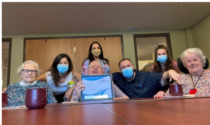
Équipe du conseil des résidents, Deer Park Villa,