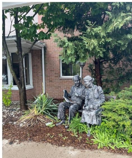
Gilmore Lodge, Grimsby